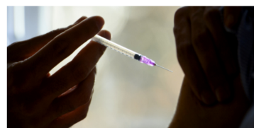
Covid-19: Coordenação do Plano de Vacinação alerta que são precisos mais meios