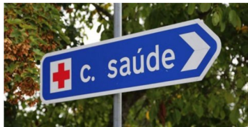
Governo diz que rejeitar inscrições de utentes nos centros de saúde é uma irresponsabilidade