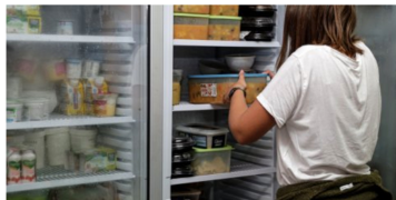
Número de pessoas apoiadas pela Refood em Faro quadruplicou face a 2019