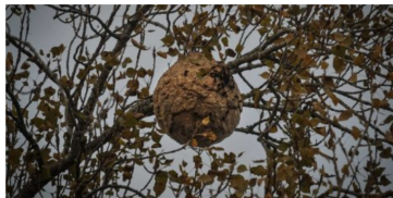
Anadia destruiu 392 ninhos de vespa asiática até ao final de outubro