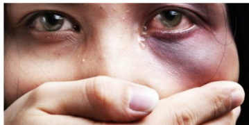
Governo lança campanha contra a "pandemia permanente" da violência doméstica