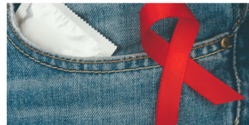
Covid-19: Diminuição de rastreios de VIH pode aumentar infeções por décadas - estudo