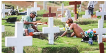
Covid-19: Pandemia já matou pelo menos 5.148.939 pessoas no mundo