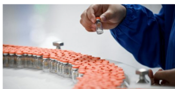
Associação quer reduzir contribuição extraordinária sobre a indústria farmacêutica