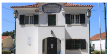
Utentes de centro de Saúde de Sintra realizam vigília contra encerramento provisório