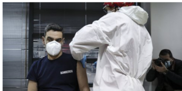
Covid-19: Profissionais do setor social e bombeiros começam hoje a ser vacinados