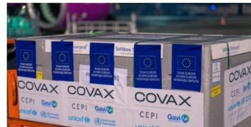
Covid-19: UE anuncia envio de quase 100 milhões de vacinas para África