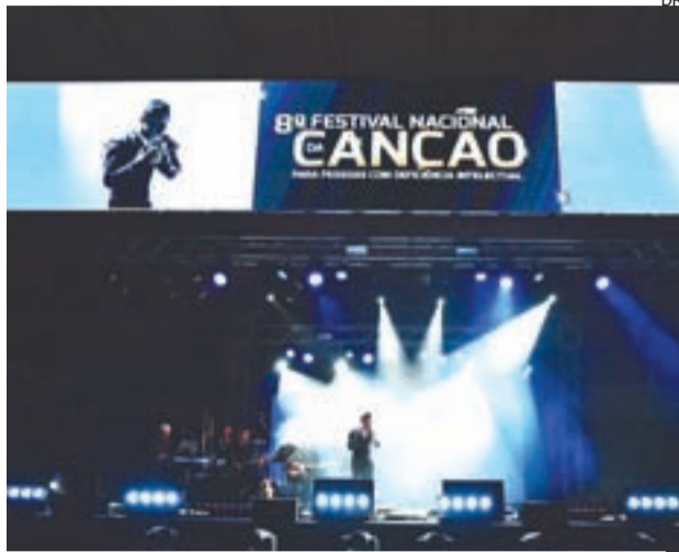
A produção cénica recorreu às recentes tecnologias de palco.

Aliás, a organização do festival esteve a cargo desta IPSS, dando continuidade a um projeto com quase uma década de existência. A qualidade e performan-