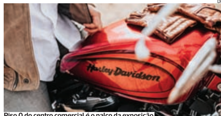
Piso 0 do centro comercial é o palco da exposição

na cidade de Coimbra de uma das marcas mais adoradas do mundo, com fãs dos oito aos oitenta anos, vindos dos mais variados contextos e cantos do Mundo. Regendo-se por valores como a independência, autenticidade e paixão na estrada, esta vai ser uma experiência única a não perder”,