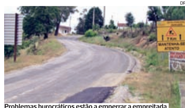
Problemas burocráticos estão a emperrar a empreitada

As obras no troço Arganil/Coja da EN 342, suspensas desde o início de abril, deverão agora ser retomadas, após a Secretária de Estado das Infraestruturas ter publicado um despacho de delegação ao órgão de direção das Infraestruturas de Portugal.