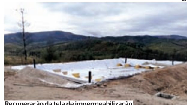
Recuperação da tela de impermeabilização

Estão em curso os trabalhos de reposição das condições de funcionamento das Estações de Tratamento de Águas Residuais (ETAR) da Cerdeira e da Zona Industrial de Coja, afetadas pelo incêndio que devastou grande parte do concelho de Arganil.