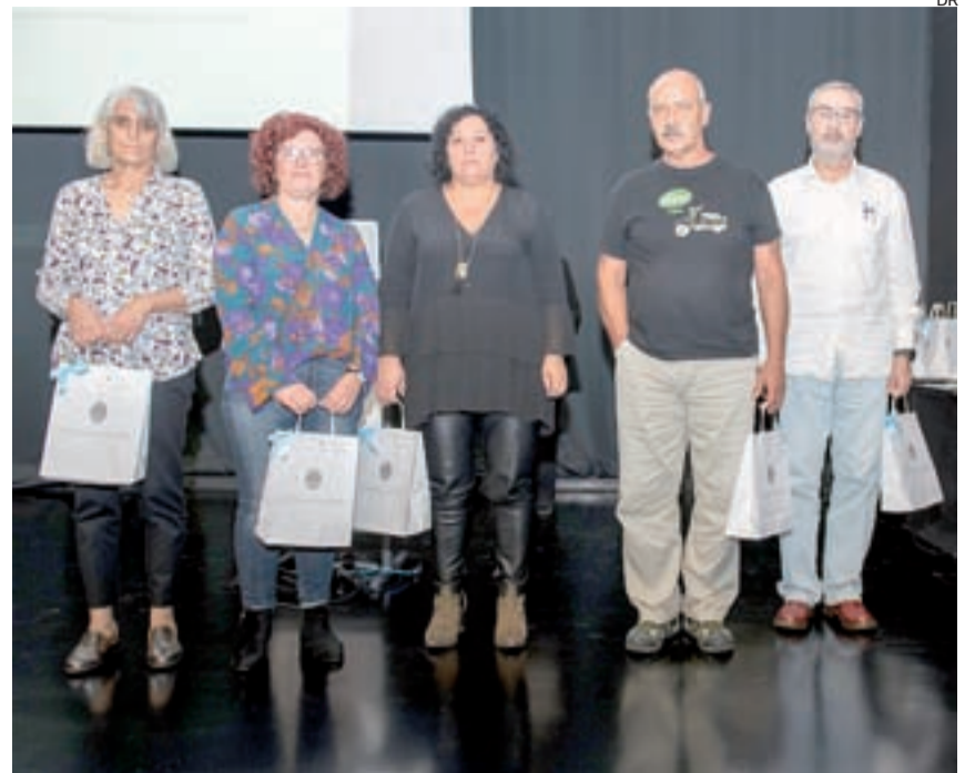
Foram entregues menções honrosas a estudantes, pessoal técnico e professores