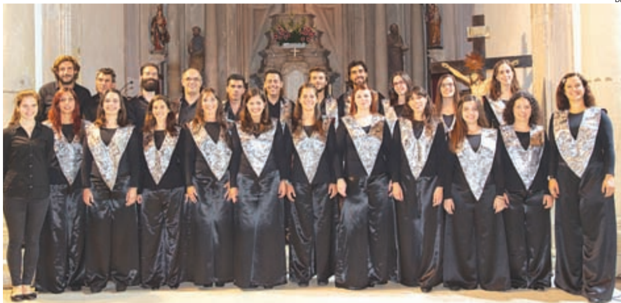
Atuação dos "Coimbra Gospel Choir" em homenagem às vítimas dos incêndios, em São Martinho da Cortiça