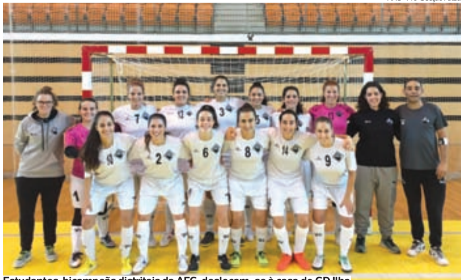
Estudantes, bicampeãs distritais da AFC, deslocam-se à casa do GD Ilha