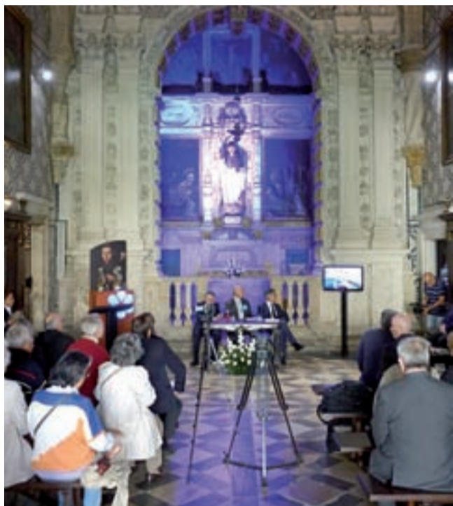
Divulgação do programa decorreu no Mosteiro de Santa Cruz