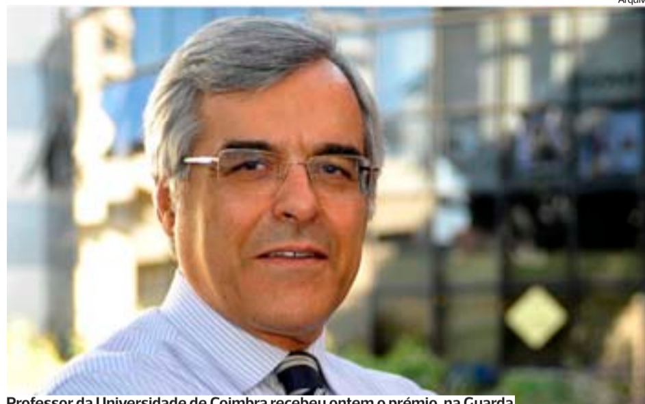
Professor da Universidade de Coimbra recebeu ontem o prémio, na Guarda

“Acrece a isto que eu não só sou discípulo e leitor de Eduardo Lourenço há muitos anos, como tenho o privilégio de ser seu amigo e de ele ser meu amigo. Eu trato-o carinhosamente por mestre, mas há mais do que carinho nisto. Há também, realmente, um