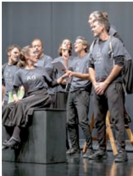
“Traviata Periódica” (pela Marionet)