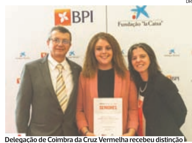
Delegação de Coimbra da Cruz Vermelha recebeu distinção

Fundada na Holanda nos anos 70 tem vindo a ser integrada em instituições diversas, como lares de idosos, mas com o “ALMA Snoez” passa a ser integrada no domicílio, proporcionando maior conforto aos utentes e a possibilidade de pessoas acamadas usufruírem dos benefícios desta terapia.