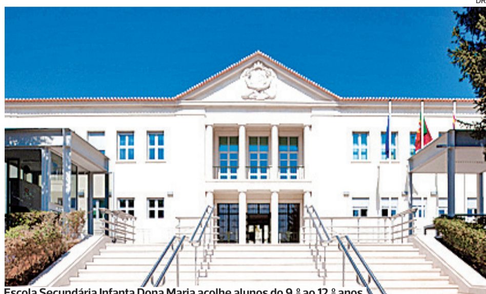
Escola Secundária Infanta Dona Maria acolhe alunos do 9.º ao 12.º anos

O quadro exposto “desaconselha a redução do número de trabalhadores e permite antecipar um cenário de forte perturba-