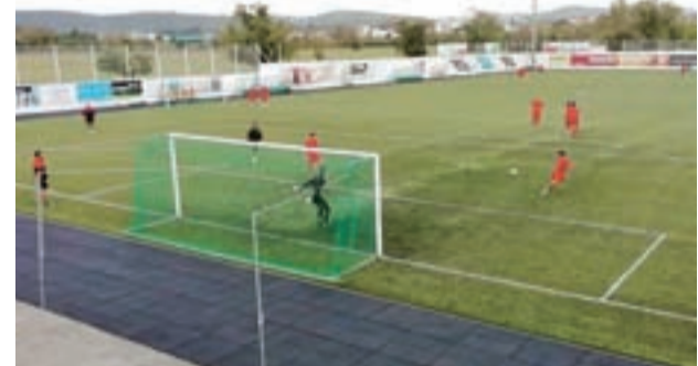
Condeixa fez, ontem de manhã, último treino antes do desafio