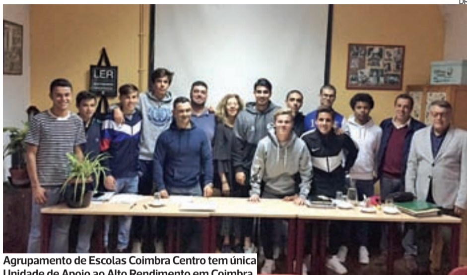
Agrupamento de Escolas Coimbra Centro tem única Unidade de Apoio ao Alto Rendimento em Coimbra

Este ano, o projeto UAARE - Unidades de Apoio ao Alto Rendimento na Escola chega a 16 escolas de nove distritos. Ao todo, contam com o apoio pedagógico 366 alunos, 33% dos quais a viver fora da sua cidade de origem.