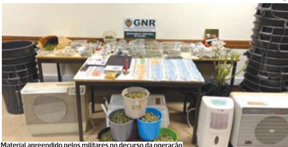
Material apreendido pelos militares no decurso da operação

Detenção aconteceu esta quarta-feira em Oliveira do Hospital, por suspeita de “tráfico de estupefacientes” na zona Centro