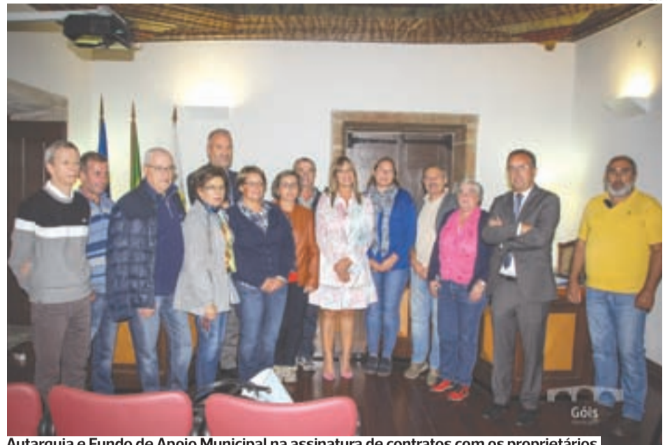
Autarquia e Fundo de Apoio Municipal na assinatura de contratos com os proprietários