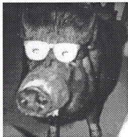
iL Maiale Nero