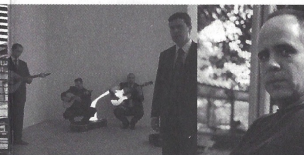
CANÇÃO DE COIMBRA