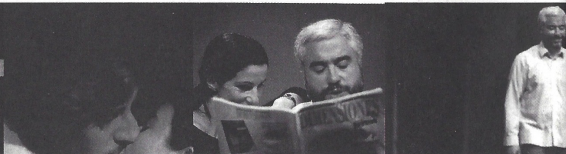
647 - O VIZINHO DA BESTA