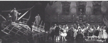
PELA BOCA MORRE O PEIXE