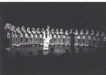
CORO FEMININO DA BULGÁRIA