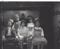
EU SOU AQUELE NEGRITO