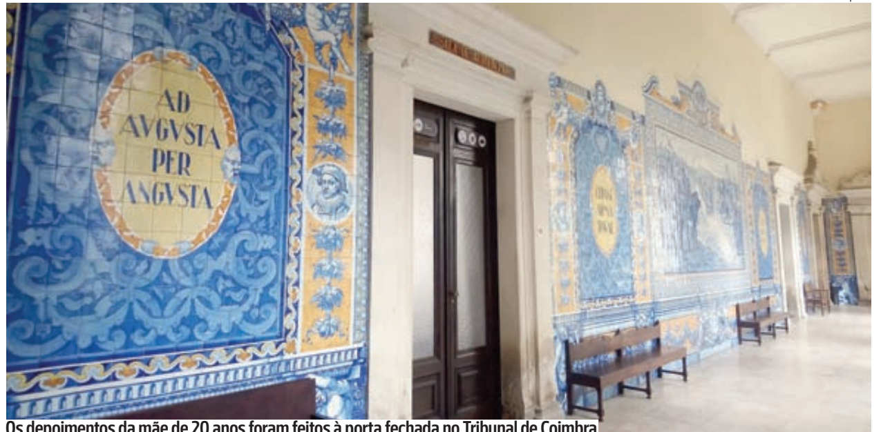
Os depoimentos da mãe de 20 anos foram feitos à porta fechada no Tribunal de Coimbra

Mulher de 20 anos confessou que tentou matar o filho, então com cinco meses