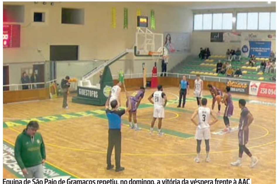
Equipa de São Paio de Gramaços repetiu, no domingo, a vitória da véspera frente à AAC

Por fim, os sub-18 fecharam a jornada no domingo, com outra vitória convincente, frente à AAC em casa, num jogo marcado pelo mau-tempo que se fez sentir na Figueira da Foz.