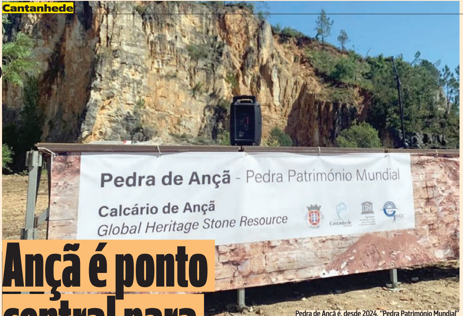
Pedra de Ançã é, desde 2024, "Pedra Património Mundial"