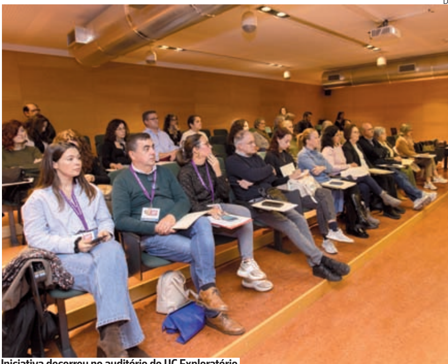
Iniciativa decorreu no auditório do UC Exploratório