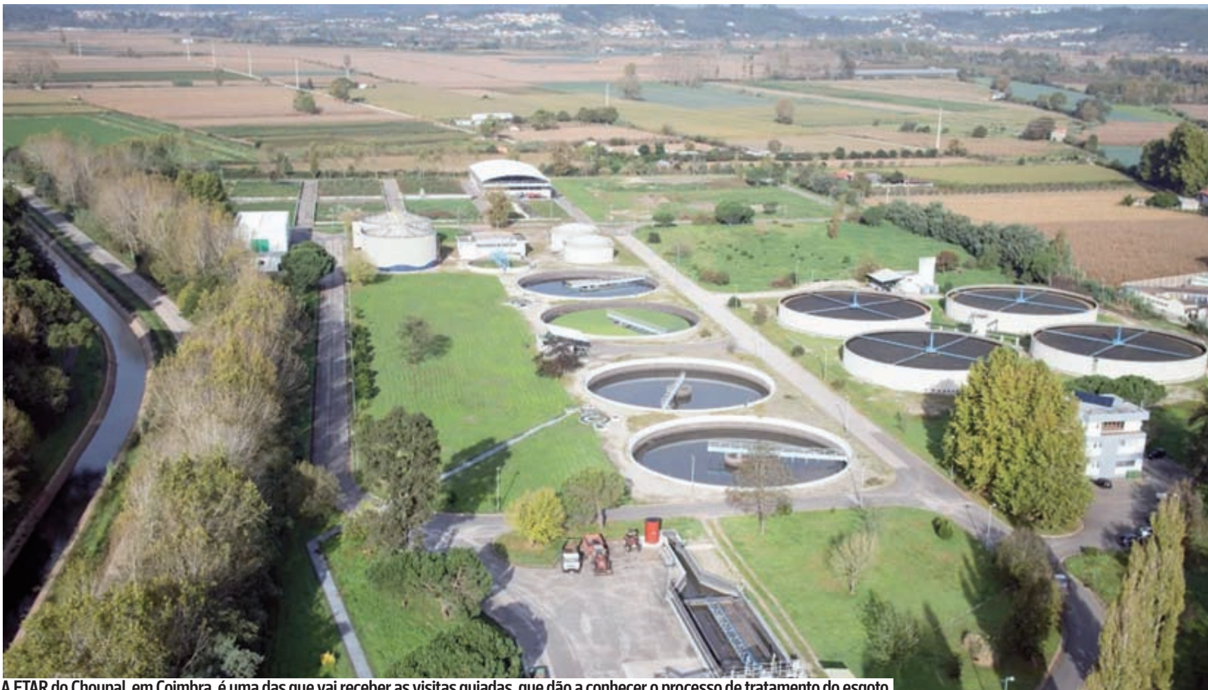
A ETAR do Choupal, em Coimbra, é uma das que vai receber as visitas guiadas, que dão a conhecer o processo de tratamento do esgoto

Durante as visitas guiadas a algumas ETAR da zona Centro, os participantes poderão conhecer cada etapa do processo de tratamento de qualidade e segurança ou à sua reutilização para outros fins