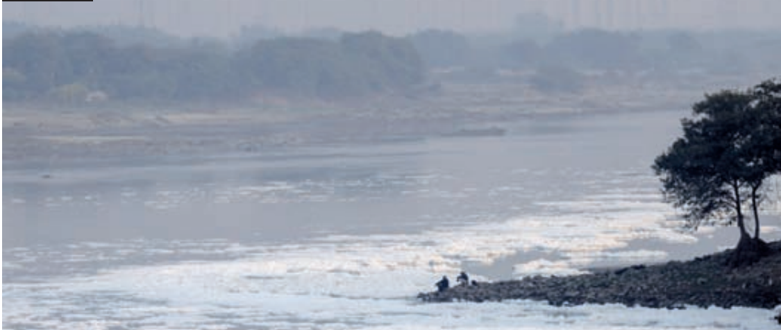
Pessoas sentadas na margem do rio Yamuna, em Nova Delhi, Índia, enquanto espuma tóxica flutua à superfície.