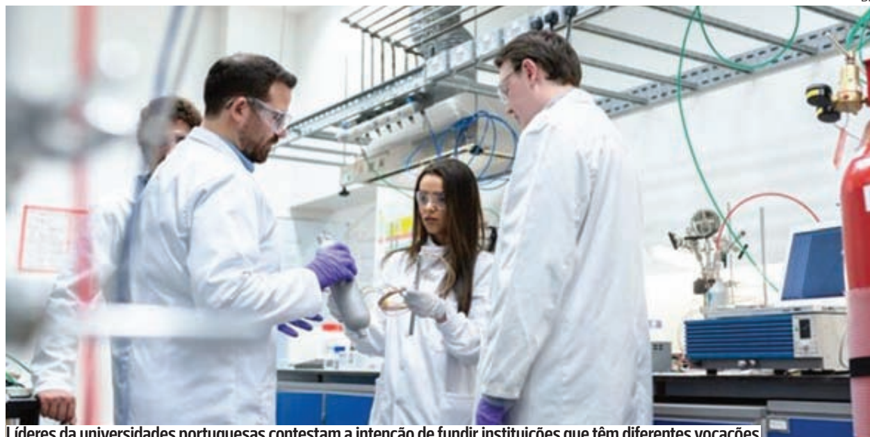
Líderes das universidades portuguesas contestam a intenção de fundir instituições que têm diferentes vocações