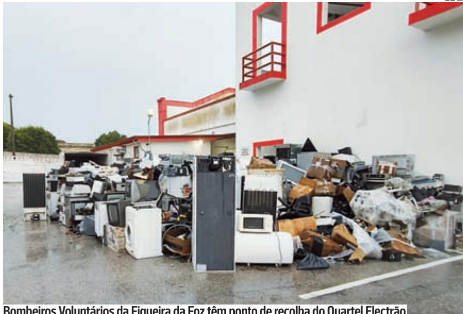
Bombeiros Voluntários da Figueira da Foz têm ponto de recolha do Quartel Electrão

“A iniciativa permite acompanhar e orientar os munícipes na correta prática de compostagem doméstica, incentivando a transformação de