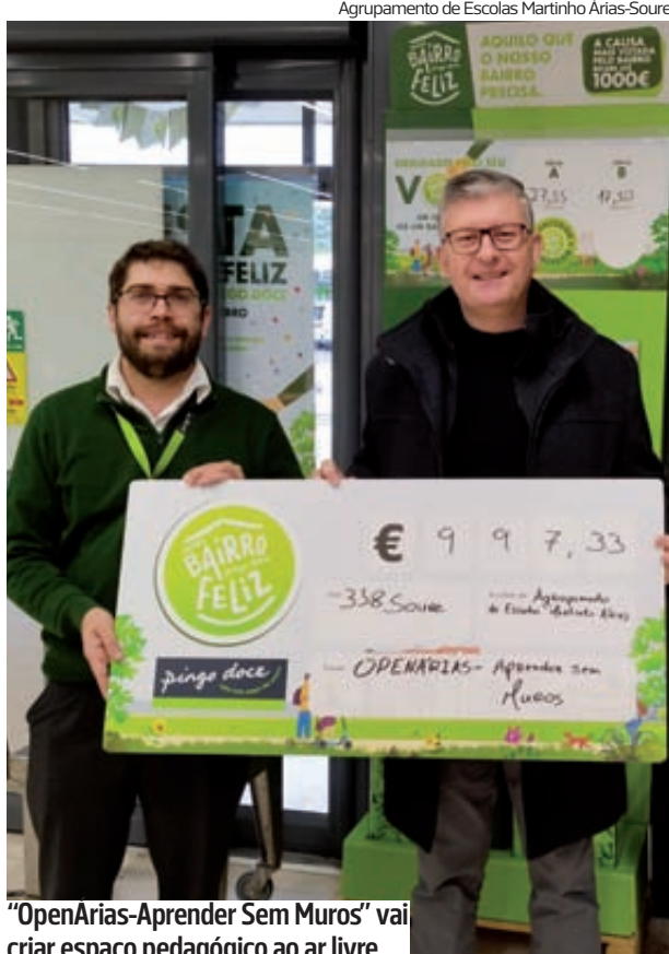
“OpenÁrias-Aprender Sem Muros” vai criar espaço pedagógico ao ar livre

Na nota divulgada, o agrupamento “expressa um profundo agradecimento a todos os que votaram, divulgaram e