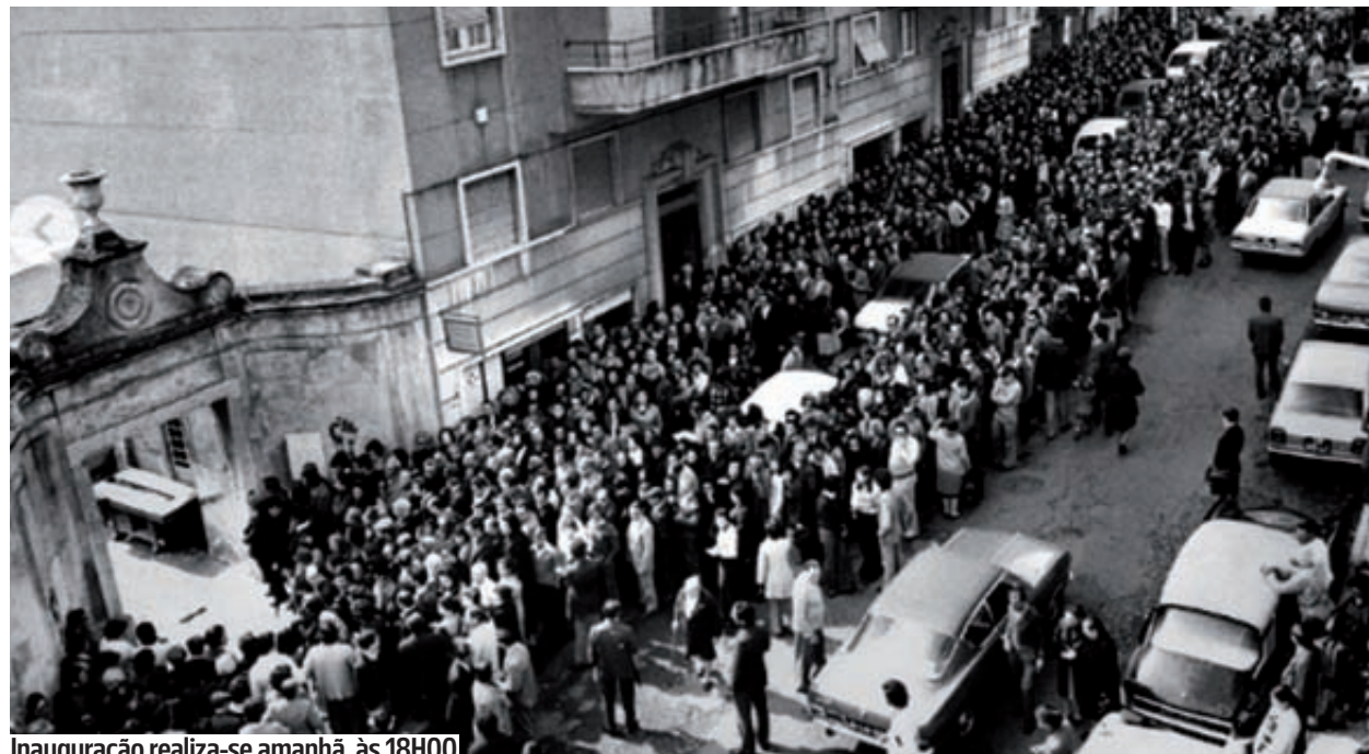
Inauguração realiza-se amanhã, às 18H00