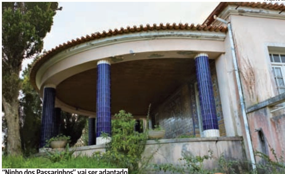
“Ninho dos Passarinhos” vai ser adaptado

Na agenda está ainda incluída a proposta de aprovação do projeto de execução e abertura do