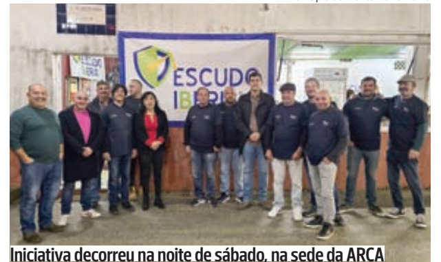
Iniciativa decorreu na noite de sábado, na sede da ARCA