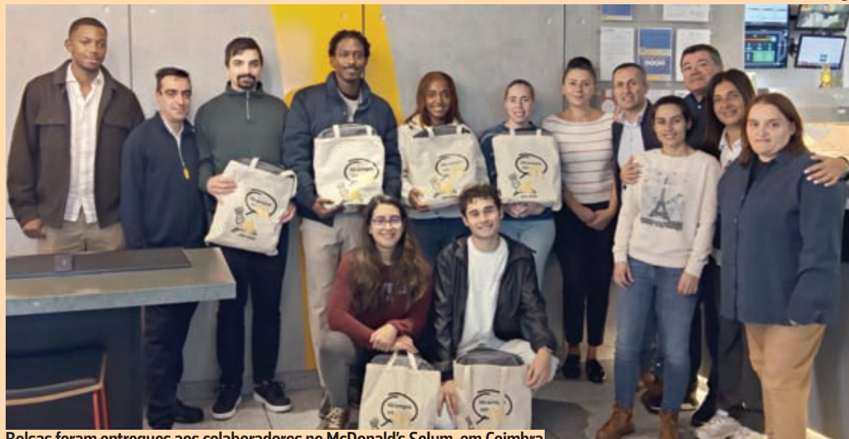
Bolsas foram entregues aos colaboradores no McDonald's Solum, em Coimbra