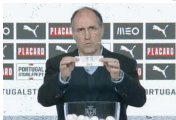
Momento em que o Chelo foi sorteado, ontem, na sede da FPF

●●● O Chelo, que venceu domingo os madeirenses do Porto Moniz (6-4), avança para a 3.ª eliminatória da Taça de Portugal e já sabe que o adversário é o São João. A outra equipa da AF Coimbra é o Vilaverdense, que vai a Castelo Branco defrontar o Boa Esperança. Os jogos disputam-se no fim de semana de 13 e 14 de dezembro.