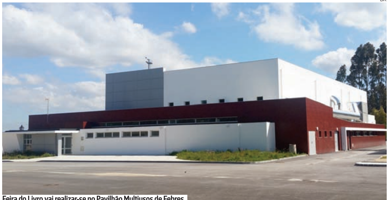
Feira do Livro vai realizar-se no Pavilhão Multiusos de Febres

●●● “Febres d’Escrita – Feira do Livro Gandaresa” realiza-se pela primeira vez ao longo de dois dias, 22 e 23 de novembro, no Pavilhão Multiusos de Febres. O evento é organizado pela ARCAF – Associação Recreativa e Cultural dos Amigos da Fontinha, com apoio da Câmara Municipal de Cantanhede, da Junta de Freguesia de Febres e da Gira Sol – Associação de Desenvolvimento de Febres.