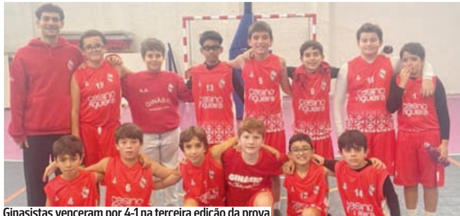
Ginastas venceram por 4-1 na terceira edição da prova

Os minis-12 do Ginásio Figueirense bateram este fim-de-semana a AAC, no III Torneio Pedro Frazão, vencendo três dos quatro períodos e empatado o outro. No final o resultado cifrou-se em 4-1, uma vez que em caso de empate, cada equipa pontua um ponto. Foi um jogo