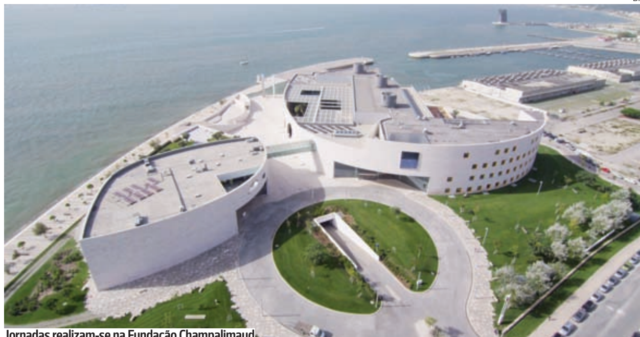
Jornadas realizam-se na Fundação Champalimaud